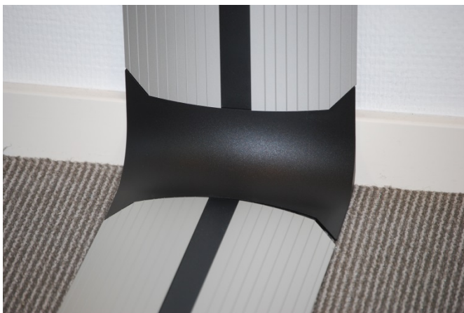
Verleng / kopelement / verticaal