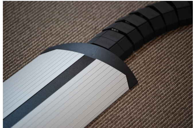
Eindstuk / overgang naar Flexkanaal