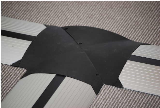
T-Stuk / splitter