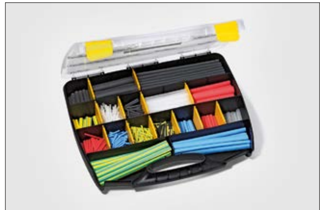
ShrinKit 321 Universal.