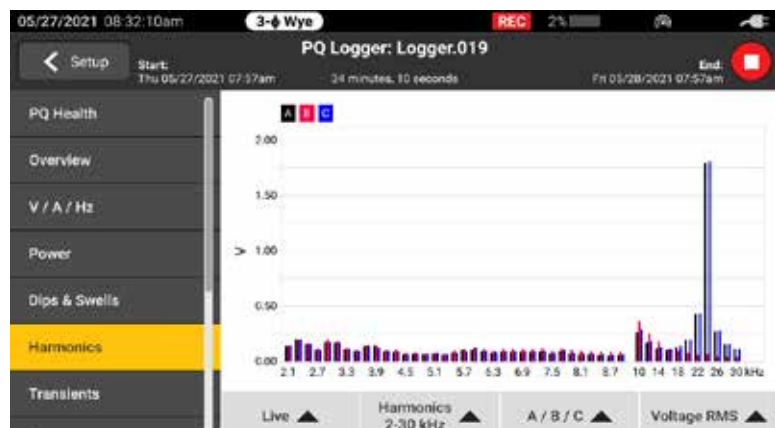
Von den ersten 50 ganzzahligen Oberschwingungen und von 2 kHz bis 30 kHz ist eine vollständige Übersicht der Oberschwingung verfügbar

Die Fluke Serie 1770 ist für den sicheren und einfachen Einsatz in jeder Messumgebung konzipiert. Mit ihr lassen sich eine Vielzahl von Messgrößen der Netzqualität sowie von schnellen Signalen und Transienten sowie Oberschwingungen höherer Frequenzen erfassen, die alle sofort auf dem großen, hochauflösenden Bildschirm sichtbar sind. Mit Sicherheit gemäß den Überspannungskategorien CAT IV 600 V/ CAT III 1000 V können diese Analysatoren an der Einspeisung oder an nachgelagerten Komponenten AC- und DC-Eingänge sowie Oberschwingungen bis zu 30 kHz messen. Mit der Serie 1770 können Sie sicher sein, die nötigen Daten zu erfassen, mit denen Sie unabhängig von der Aufgabe bessere Entscheidungen zur Instandhaltung treffen können.