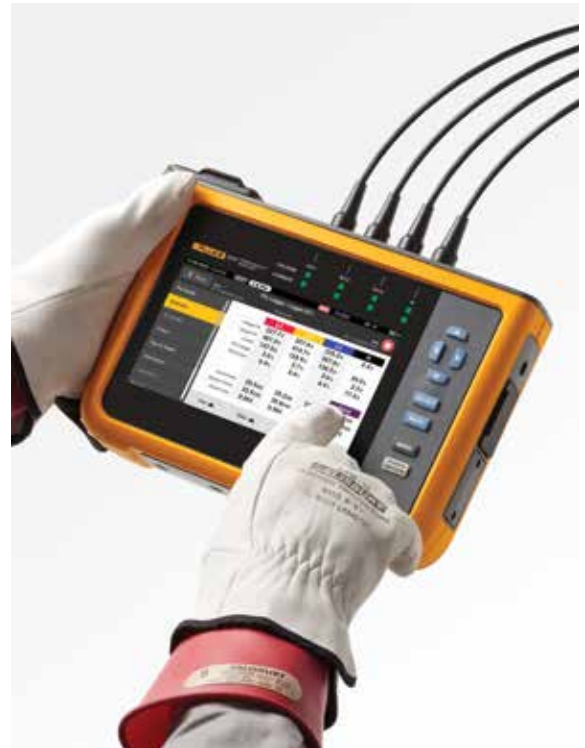
Bequeme Navigation auf dem großen Farb-Touchscreen

Beim Herunterladen von Daten aus den Netzqualitätsanalysatoren der Fluke Serie 1770 kann das mitgelieferte Softwarepaket Energy Analyze Plus statistische Daten zur gemessenen Spannung und zu Stromüberschwingungen mit verschiedenen Normen wie EN 50160 oder IEEE 519 vergleichen und so ermitteln, ob sie die Konformitätsgrenzen überschreiten. Mit dieser leistungsstarken Funktion für die vorausschauende Instandhaltung lassen sich Stromüberschwingungen beobachten, bevor eine Verzerrung der Spannung auftritt. So können Sie unerwartete Fehler oder Konformitätsverstöße verhindern und die Systemverfügbarkeit verbessern. Die Verbreitung von Lasten und Stromversorgungen mit Wechselrichtern macht es immer wichtiger, die Stromüberschwingungen unter Kontrolle zu halten, um eine zuverlässige Netzqualität zu gewährleisten und Systemausfallzeiten zu vermeiden.