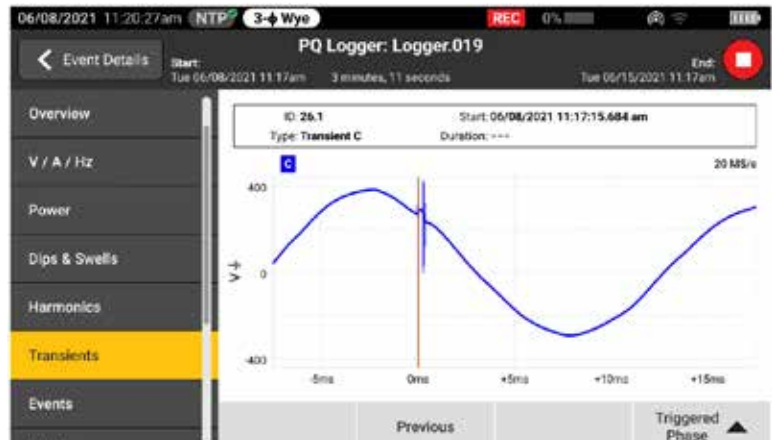
Schnellere Problembeseitigung durch Anzeige von Transienten in Echtzeit, während die Protokollierung noch läuft

Transienten wirken sich tagtäglich negativ auf ansonsten einwandfreie Systeme aus und ihr Potenzial zur Schädigung von Anlagen darf nicht unterschätzt werden. Unabhängig davon, ob in Ihrem System Impuls- oder Schwingungstransienten auftreten, können die Ergebnisse verheerend sein und Probleme verursachen, die von beschädigter Isolierung bis hin zu Totalausfällen von Anlagen reichen. Fluke 1775 und Fluke 1777 verfügen über innovative Technologie zur Transientenerfassung, mit der Sie schnelle Spannungstransienten eindeutig erkennen können und über die nötigen Daten verfügen, um ihre Entstehung zu vermeiden. Der Netzqualitätsanalysator Fluke 1775 hat eine Abtastrate von 1 MHz zur Erfassung schneller Transienten, das Modell Fluke 1777 von 20 MHz, um auch die schnellsten Transienten mit hoher Detailgenauigkeit zu erfassen.