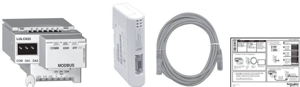
Modbus Communication Module Module de communication Modbus Модуль связи Modbus LULC033