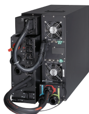
UPS 9PX 11 kVA s údržbovým bypassem