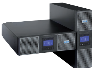
Universální provedení rack / tower