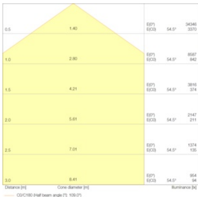
LDC typ cone