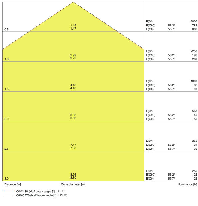
LDC typ cone