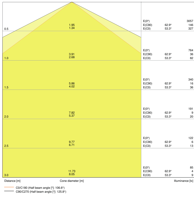
LDC typ cone