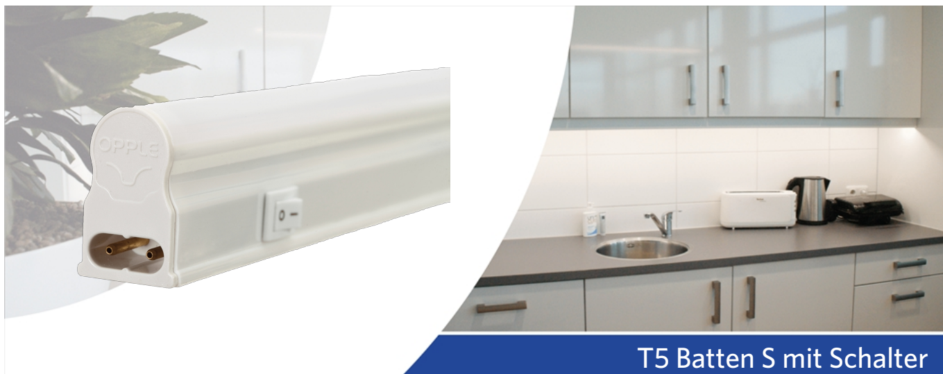
T5 Batten S mit Schalter