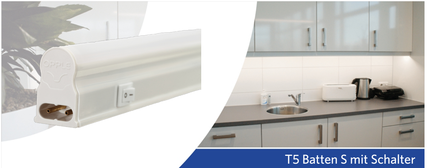
T5 Batten S mit Schalter