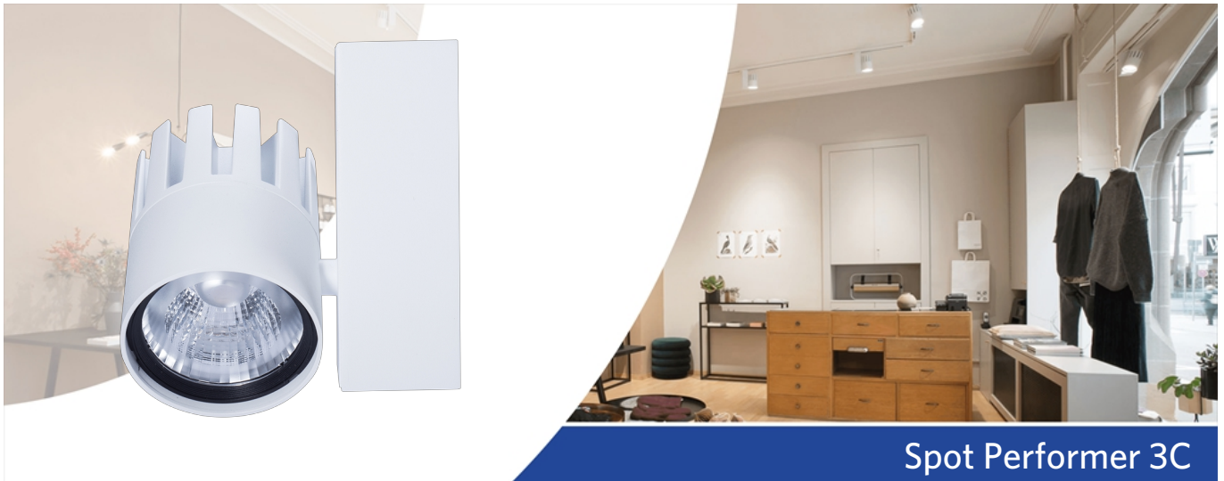
Spot Performer 3C