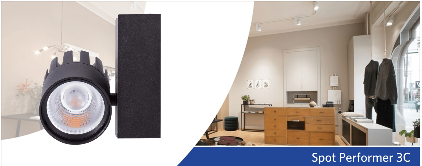
Spot Performer 3C