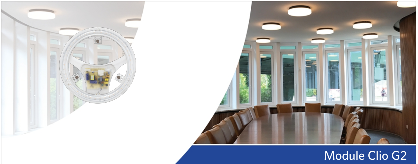
Module Clio G2