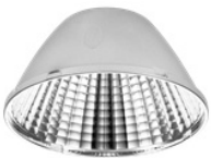
550098000300 LEDSpot3C-C-P R85-Reflector-24D