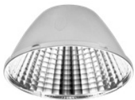
550098000500 LEDSpot3C-C-P R100- Reflector-24D