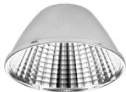
541001188000 LEDSpot3C-C-CS R75-Reflector-24D