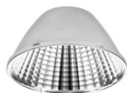
541001187800 LEDspot3C-C-CS R47-Reflector-24D