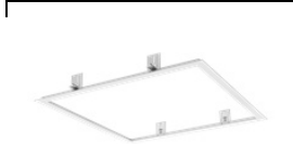
542098009600 LEDPanelRc Sq600-Frame-WH