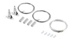
599006009000 LEDLima Suspension-Kit