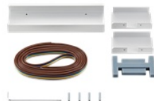
599006008900 LEDLima Connection-Kit