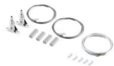
599006009000 LEDLima Suspension-Kit