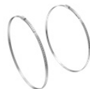
709098001600 FloodOly-P Mounting-Kit-Out-Pole