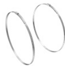
709098001600 FloodOly-P Mounting-Kit-Out-Pole