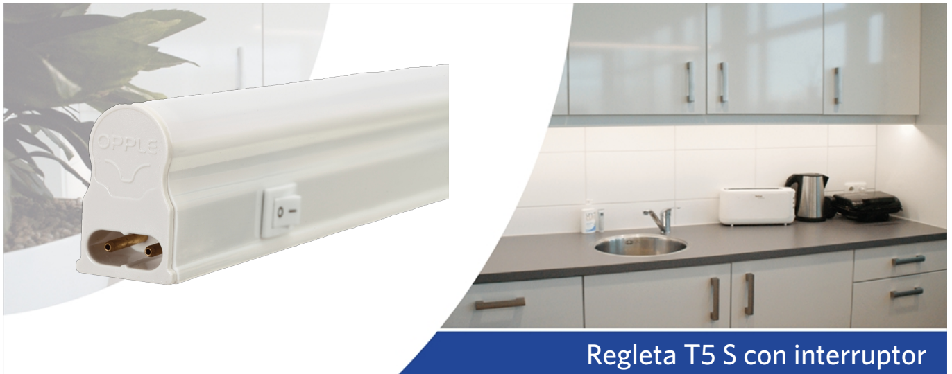
Regleta T5 S con interruptor