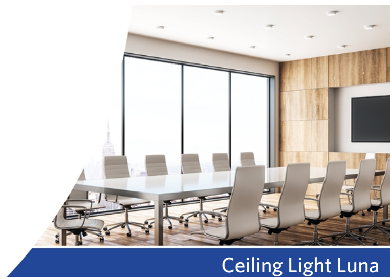
Ceiling Light Luna