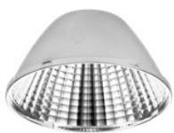
550098000300 LEDSpot3C-C-P R85-Reflector-24D