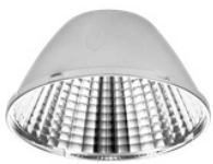
550098000300 LEDSpot3C-C-P R85-Reflector-24D