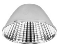
550098000300 LEDSpot3C-C-P R85-Reflector-24D