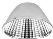
541001187900 LEDSpot3C-C-CS R68-Reflector-24D