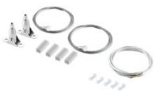
599006009000 LEDLima Suspension-Kit