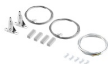
599006009000 LEDLima Suspension-Kit