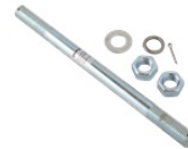
545098003200 LEDHighbay-Pole and Adapter