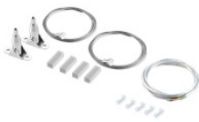
599006009000 LEDLima Suspension-Kit