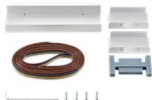
599006008900 LEDLima Connection-Kit