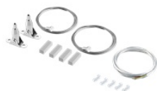
599006009000 LEDLima Suspension-Kit