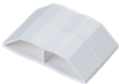
140063307 LED T8 Batten connector