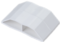
140063307 LED T8 Batten connector