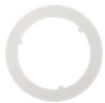
140060650 LEDDownlightRc-HZdim- Adapter-125-150