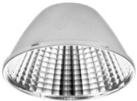
550098000300 LEDSpot3C-C-P R85-Reflector-24D