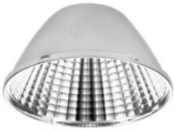
550098000300 LEDSpot3C-C-P R85-Reflector-24D