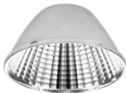
541001187900 LEDSpot3C-C-CS R68-Reflector-24D