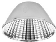
541001187900 LEDSpot3C-C-CS R68-Reflector-24D