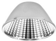
541001188000 LEDSpot3C-C-CS R75-Reflector-24D