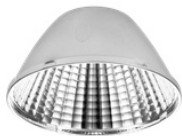
541001188000 LEDspot3C-C-CS R75-Reflector-24D