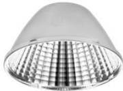
541001187800 LEDSpot3C-C-CS R47-Reflector-24D