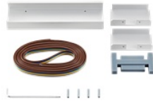
599006008900 LEDLima Connection-Kit