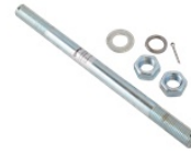
545098003200 LEDHighbay-Pole and Adapter