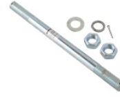
545098003200 LEDHighbay-Pole and Adapter