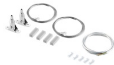
599006009000 LEDLima Suspension-Kit