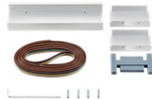
599006008900 LEDLima Connection-Kit