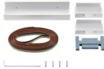
599006008900 LEDLima Connection-Kit