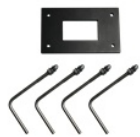
703098000300 LEDBollard-Luke-E Concrete-Mounting-Kit